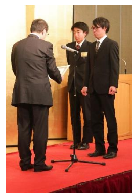
↑ 功績賞（団体）受賞 塩釜FCユース様