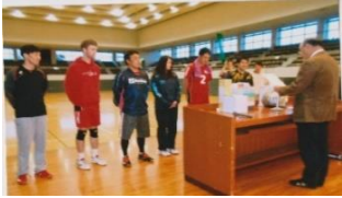
↑一般男子（9人制）の部 優勝チーム Style

今大会は、主催・仙塩Cup 2018 in 塩竈大会実行委員会、主管・塩竈市バレーボール協会、後援・塩竈市／塩釜市体育協会のもとに行われ、