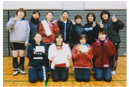
家庭バレー（8人制）の部 優勝チーム CATS EYE

どの試合でも、熱戦が繰り広げられ、大会は大いに盛り上がりました。試合は、仙台市が強さを見せ、一般男子（9人制）の部ではStyle、家庭バレー（8人制）の部ではCATS EYEが優勝しました。