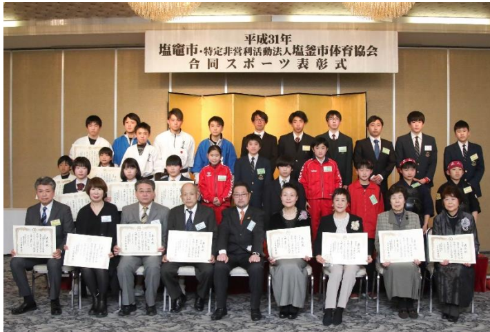
→功労賞・功績賞・武道大賞を受賞した皆様

平成三十一年二月九日、特定非営利活動法人塩竈市体育協会の平成三十一年スポーツ表彰式がグラウンドパレス塩竈で行われました。 この表彰式では、塩竈市体育協会、各加盟単位協会において事業発展のために功績のあった個人や団体に「功労賞」「功績賞」を。また、武道競技において、優秀な成績を収められた方には「塩竈市武道大賞」を授与いたしました。ここに、受賞された皆様を紹介いたします。