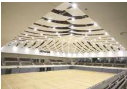
→開放感のある天井

改修工事と聞いて、 利用者だけでなく、 我々スタッフも気にな るところと言えば、や はりトイレでしょう！ 特に第一競技場器具 庫付近のトイレは和式 でしたので、洋式への切 り替えは熱望でした。 結果はご覧のとおり、 館内すべてのトイレがバ リアフリーで老若男女 が利用しやすい洋式ト イレに変身しました。