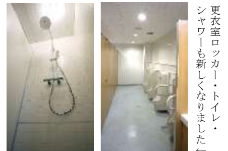
更衣室ロッカー・トイレ・ シャワーも新しくなりました！