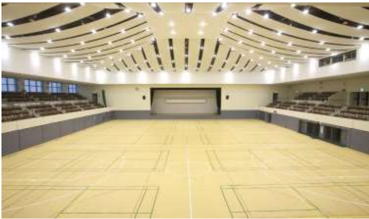
↑新第一競技場・↓旧第一競技場