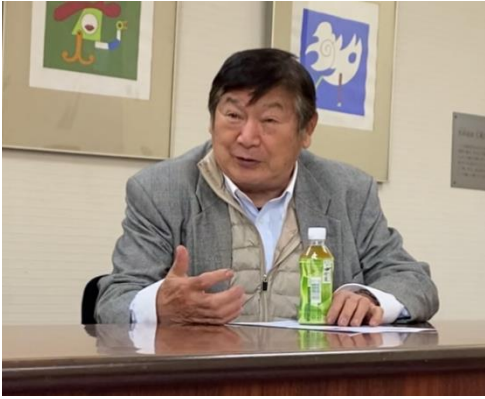
→巧みな話術で聞き手を飽きさせない。インタビューはあっという間でした。