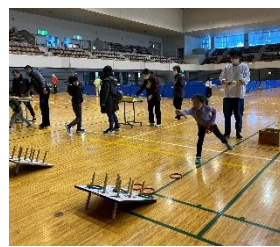
右…輪投げ 左…ストラックアウト