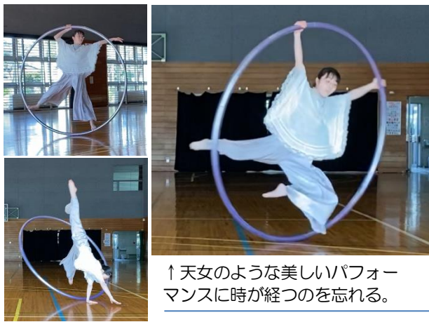
↑天女のような美しいパフォーマンスに時が経つのを忘れる。

かされていると感じますがCyrwheel（シルホイール）を始めたのは、実は昨年の3月からというのだから驚きです。今は高難度の技や複雑な動きを練習中とのこと。最後に、今後の目標をお聞きすると、「このパフォーマンスを仕事にすることで」と、語りました。ぜひ、叶えて頂きたいものです。