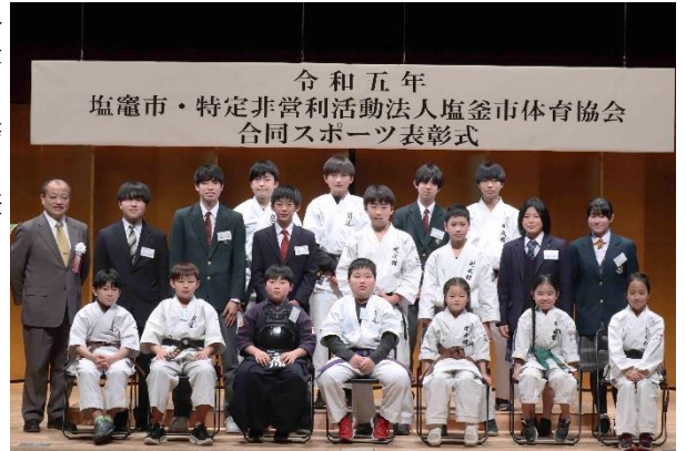
↑ 功績賞を受賞されたみなさま