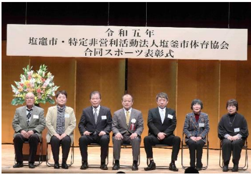
↑ 功労賞を受賞されたみなさま